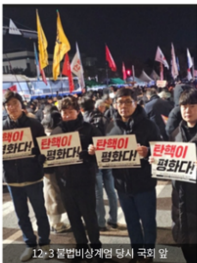
12·3 불법비상계엄 당시 국회 앞