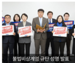
불법비상계엄 규탄 성명 발표