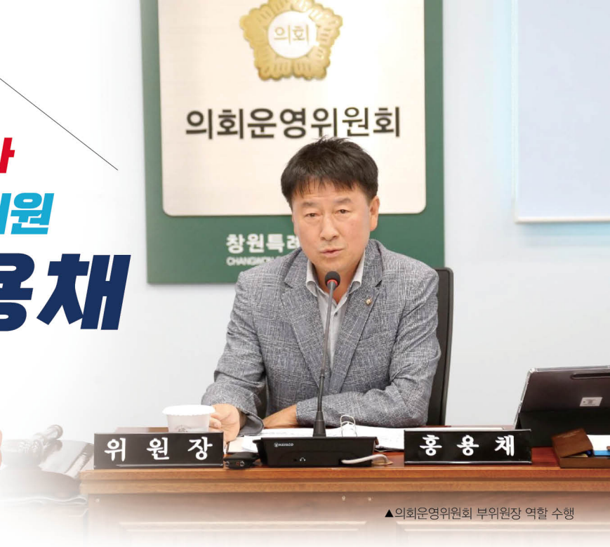
▲의회운영위원회 부위원장 역할 수행

존경하는 창원시민 여러분, 그리고 자산·오동·교방·합포·산호동 주민 여러분, 안녕하십니까.