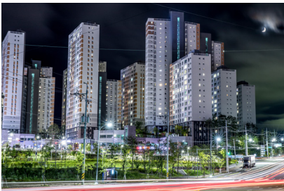
▲ 구름산지구 조감도

“ 개발에서 끝나지 않고 시민의 삶까지 완성되는 광명을 만들겠습니다! ”