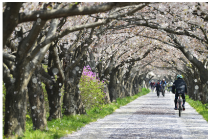
▲ 쾌적한 공원·녹지