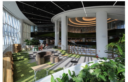
▲ 편리한 생활 인프라