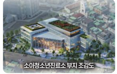
소아청소년진료소 부지 조감도