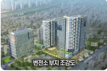
변전소 부지 조감도