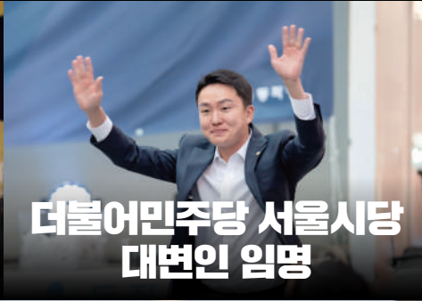
더불어민주당 서울시당 대변인 임명