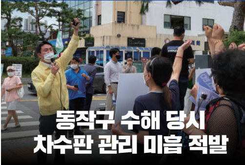
동작구 수해 당시 차수관 관리 미흡 적발