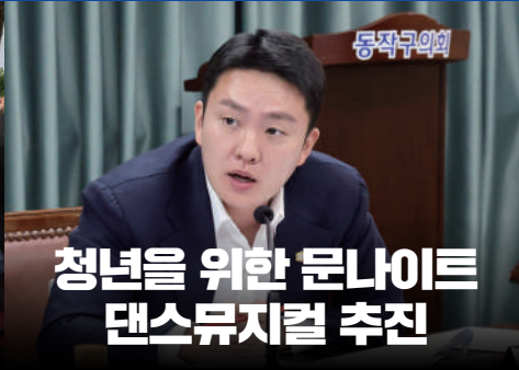
청년을 위한 문나이트 댄스뮤지컬 추진