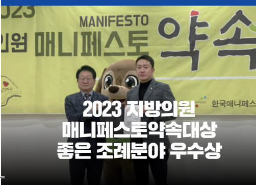
2023 지방의원 매니페스토약속대상 좋은 조례분야 우수상