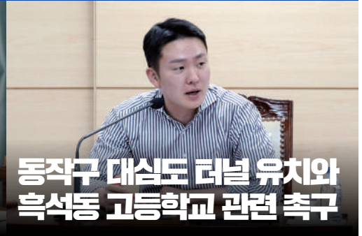
동작구 대심도 터널 유치와 흑석동 고등학교 관련 촉구