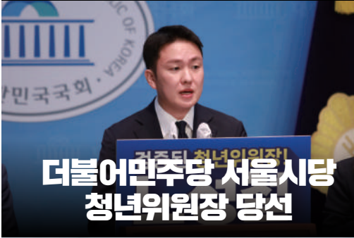
더불어민주당 서울시당 청년위원장 당선