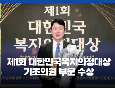
제1회 대한민국 복지의정대상 기초의원 부문 수상