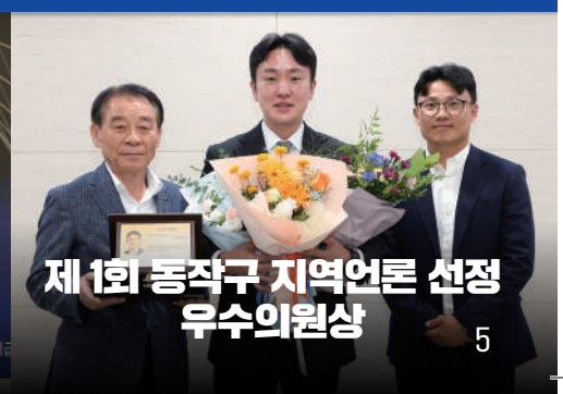
제 1회 동작구 지역언론 선정 우수의원상