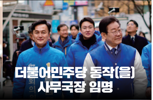
더불어민주당 동작(을) 사무국장 임명