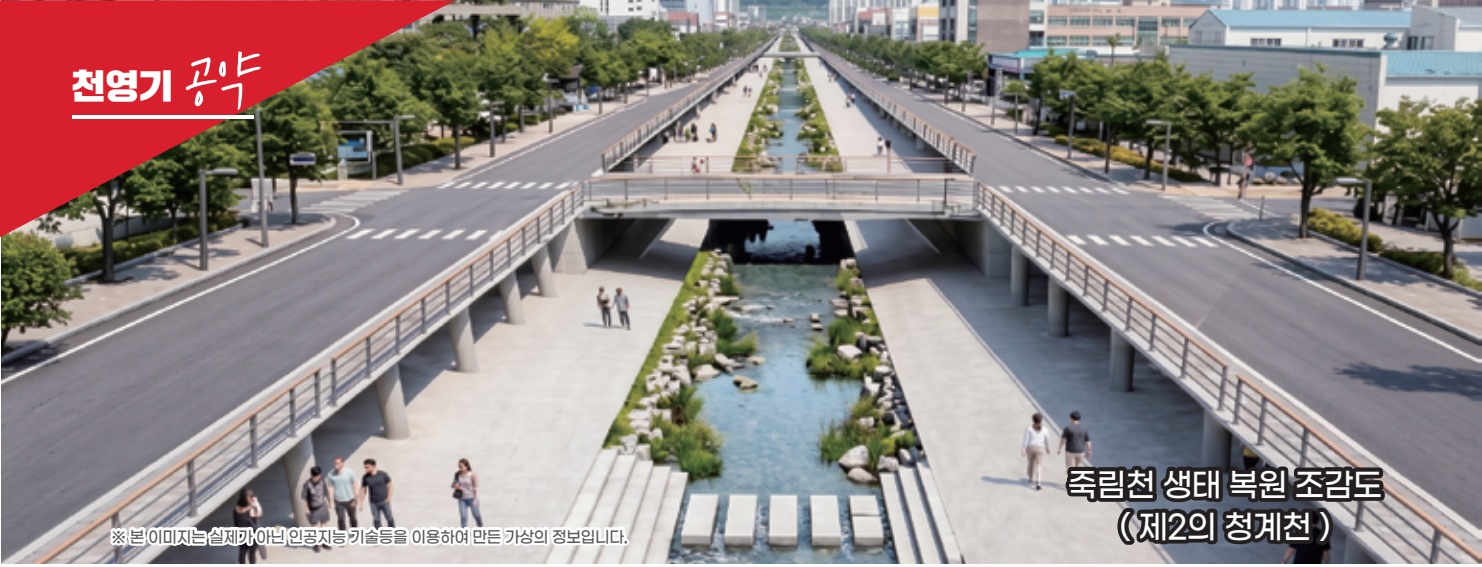
※ 본 이미지는 실제가 아닌 인공지능 기술을 이용하여 만든 가상의 정보입니다.