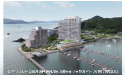
※ 본 이미지는 실제가 아닌 인공지능 기술을 이용하여 만든 가상의 정보입니다.