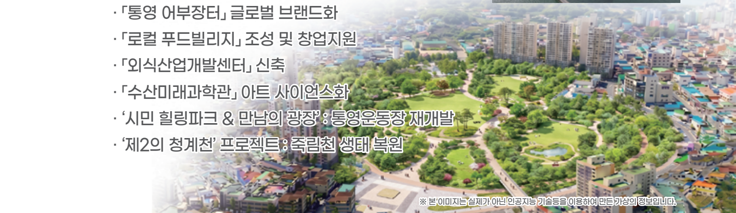
※ 본 이미지는 실제가 아닌 인공지능 기술을 이용하여 만든 가상의 정보입니다.