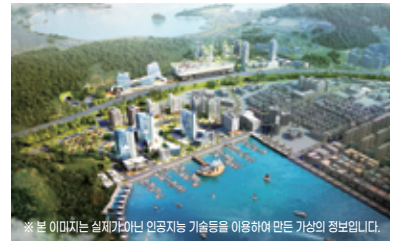
※ 본 이미지는 실제가 아닌 인공지능 기술을 이용하여 만든 가상의 정보입니다.