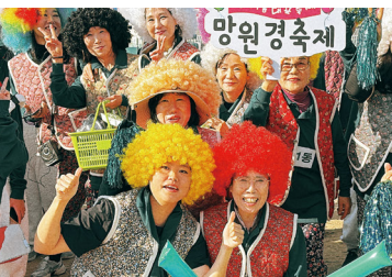
망원1동 주민들과 함께

마포구의회 토론회 운영 조례 제정 및 본회의 수어통역 운영 기반 마련 지원 | 마포구 인권보장 및 증진 조례 제정 요구 | 범죄피해자 지원 조례 및 스토킹·교제폭력 피해자 보호 조례 제·개정