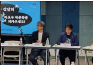
마포출판문화진흥센터 관련 출판 현장·행정 간 갈등 조정