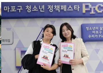
청소년 정책 페스타 참여