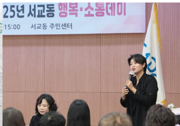
서교동 주민들과 함께