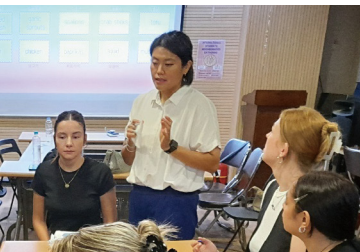
유학생 1인가구 간담회 진행

신규 소각장 입지선정 절차 문제 제기 및 쓰레기봉투 디자인 개선 요구 | 마포구 수리문화 확산 지원 조례 제정 | 마포구 소상공인 지원 관련 조례·정책 점검