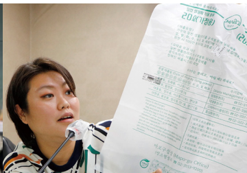
쓰레기봉투 디자인 개선 요구