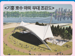
<기흥 호수 야외 무대 조감도>