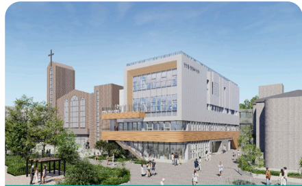
탄방동 행정복지센터 조감도