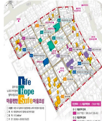
뉴빌리지 사업 구상도