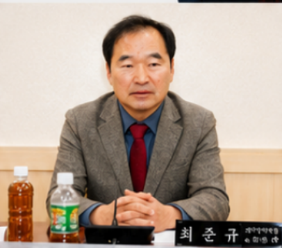
풍부한 의정 경험과 전문성으로 거창의 미래를 준비하겠습니다.