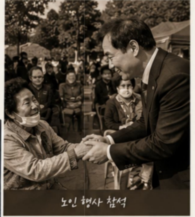
노인 행사 참석