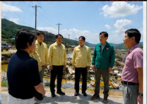
현장을 직접 보고 해결책을 찾아 실천하는 일꾼이 되겠습니다.