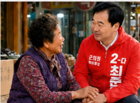
군민 한 분 한 분의 목소리에 귀 기울이겠습니다.