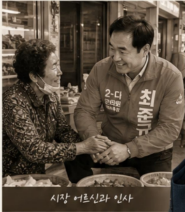
시장 어르신과 인사