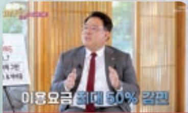
종합운동장 소음피해 보상방안 마련