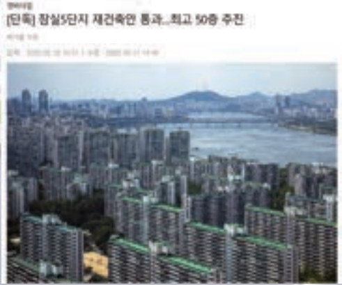
주공5단지 재건축 심의 통과(도계위 2회, 통합심의 1회)