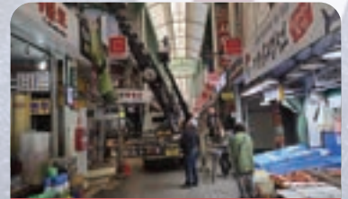
새마을시장 아케이드 공사 예산 지원