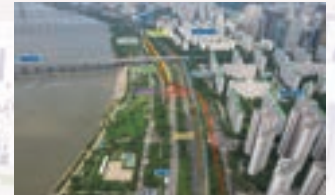
잠실대교 남단C 연결체계 개선