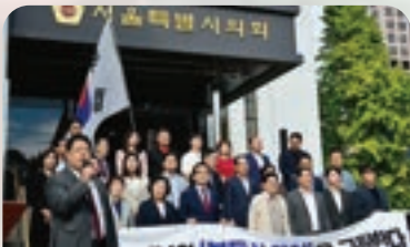
서울 전역 토지거래허가구역 지정 규탄

서울시의회 국민의힘 대표의원으로서, 예산결산특별위원장으로서 서울시와 송파구의 발전을 위해 최선을 다했습니다.