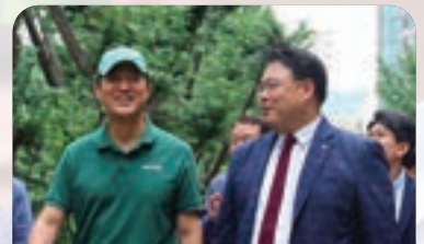
주공5단지 점검하는 오세훈 시장과 이성배 의원