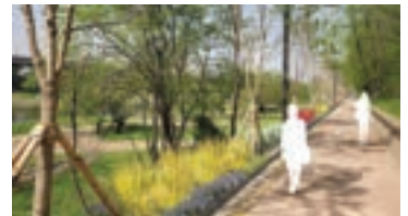
라일락 향기로 사진(가칭)