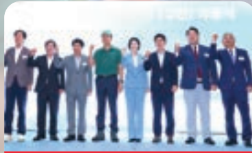
탄천변 동측도로 지하화 및 지상 공원화