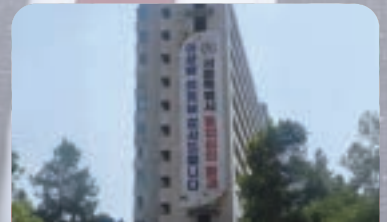
잠실주공5단지 통합심의 신속 통과