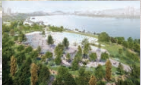
잠실 2·3동 잠실한강수영장->자연형 물놀이장으로 재탄생(서울시 예산 130억 확보)