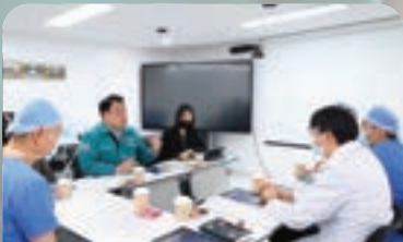
고대구로병원·국립중앙의료원 외상센터 예산 지원