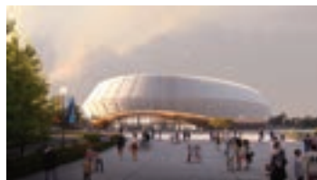
잠실 MICE 스포츠컴플렉스 조감도