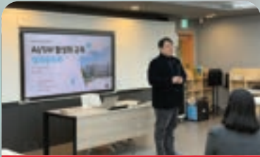
교내 학교에 AI 활성화 교육 예산 지원