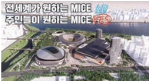
잠실 스포츠·MICE 복합공간 조감도