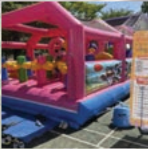
잠실근린공원에 여가저거 서울형 키즈카페 유치