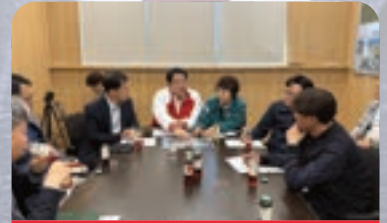
잠실 MICE·도로개선사업 현장점검