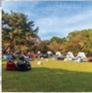
잠실에 품격있는 야외도서관 유치