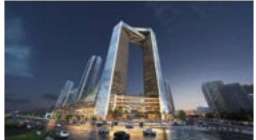
잠실 주공5단지 조감도