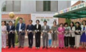
서울형 키즈카페 송파1호점 조성 지원