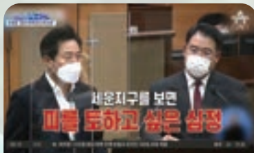
박원순 전임시장의 도시재생사업 지적