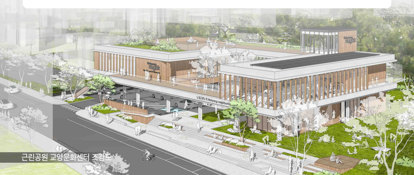
근린공원 교양문화센터 조감도