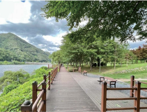
△ 도안동 무장애나눔길