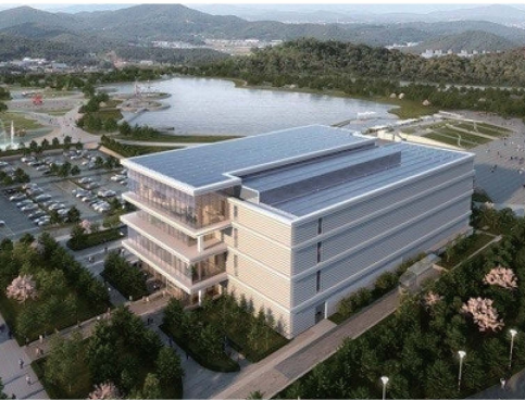
△ 관저동 생활문화복지시설 건립