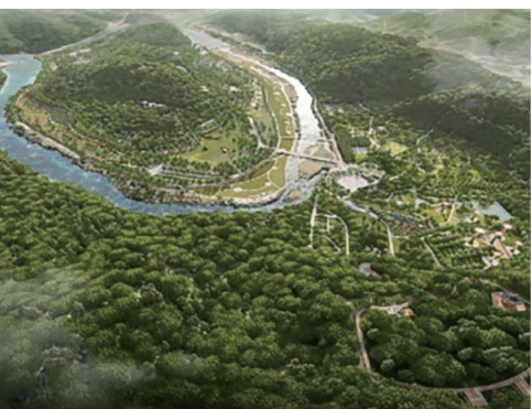
△ 노루벌 국가정원 지정