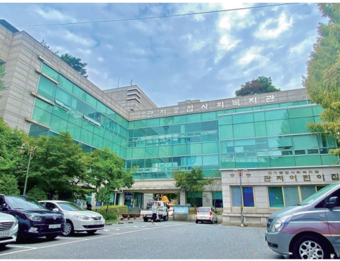
△ 관저종합사회복지관 리모델링