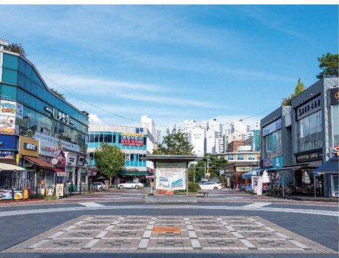
△ 마치광장 주민친화형 환경 정비 사업 추진