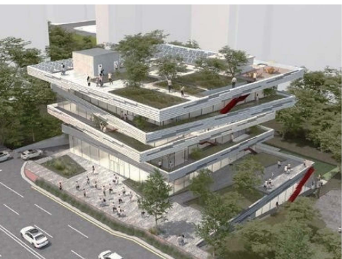
△ 관저동 제3시립도서관 건립 (디자인 설계 공모중)