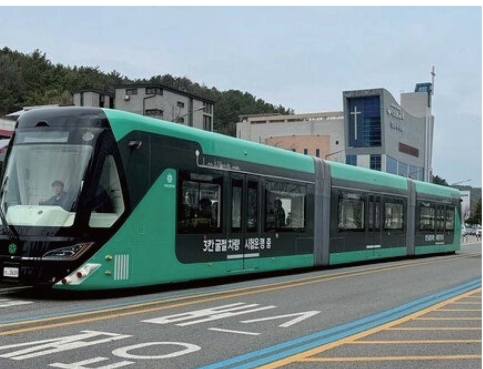
△ 신교통수단(3칸 굴절차량)