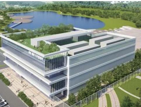
△ 도안동 국회 통합디지털센터 건립 정시 추진