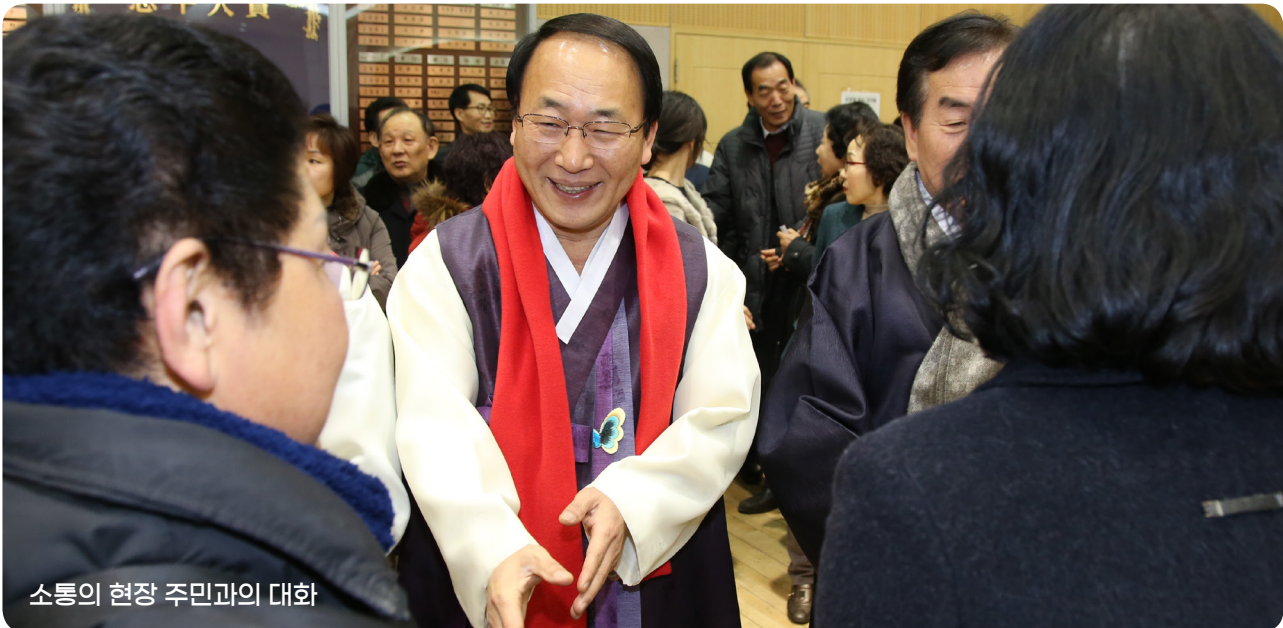
소통의 현장 주민과의 대화