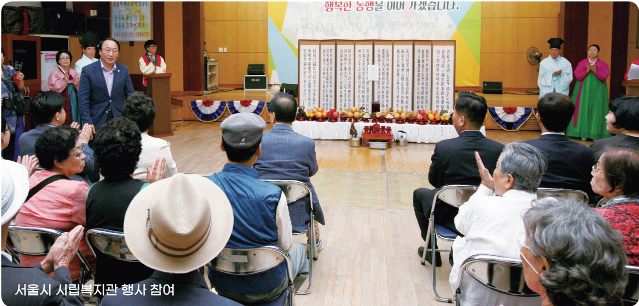
서울시 시립복지관 행사 참여