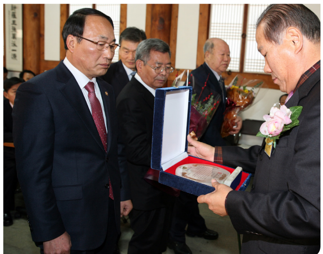
밀양 박씨 규정공파 대총회 (효자상 수상)