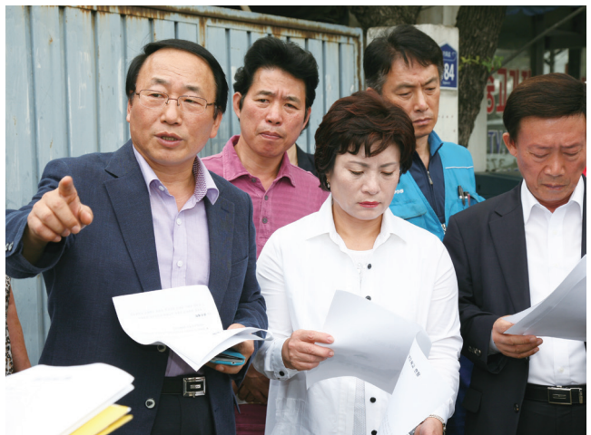
의정활동 현장 주도