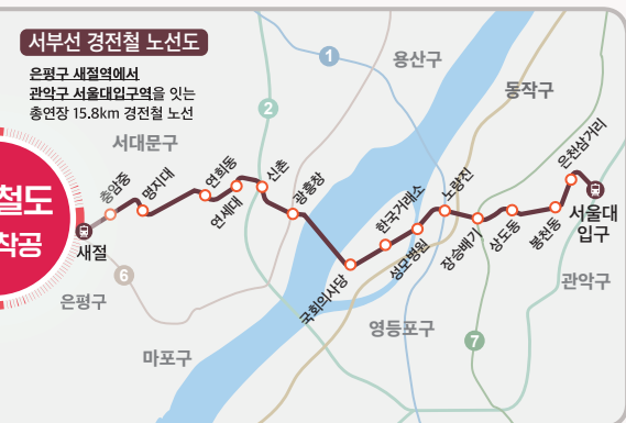
▲ 민자지정 → 재정전환 신속이행