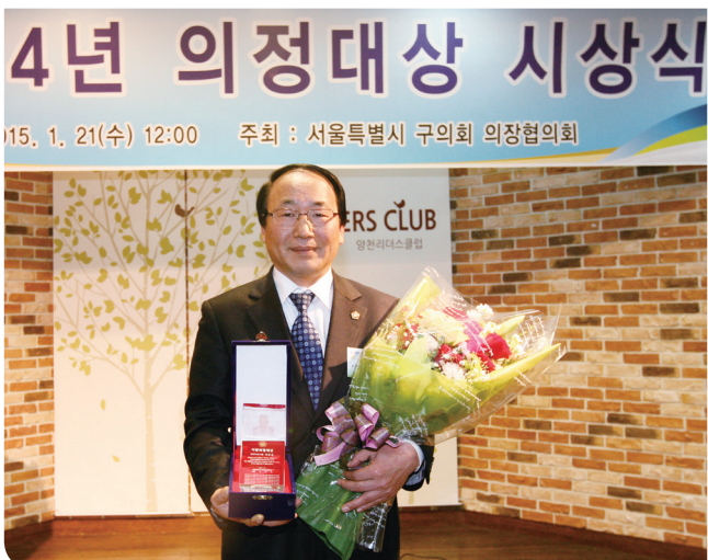
서울시 구의회 의장협의회 (의정대상 수상)