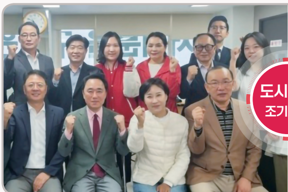
▲ 서부선 연합추진연대