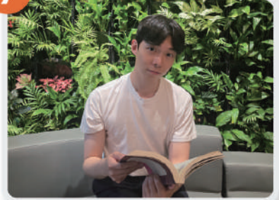
⑦ 노년층 문화 복지 확대