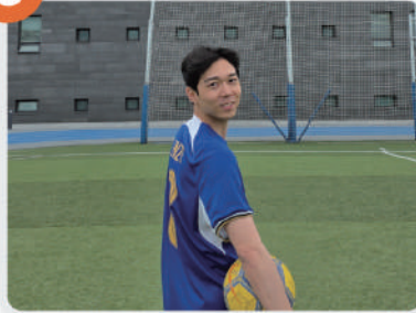
⑥ 동호회 운영 제도 개편