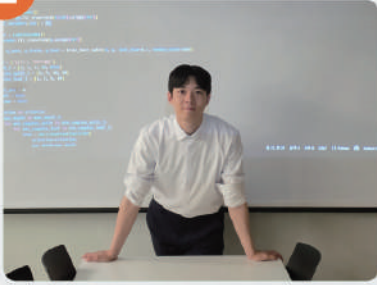
② 학생 대상 AI 개발 교육