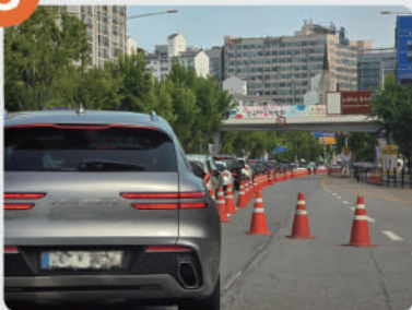
⑧ 대형행사 일정·교통 분산제도