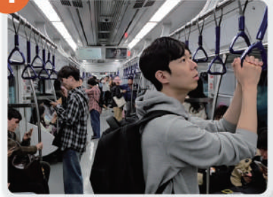
④ '집 앞에서 취준' 시스템