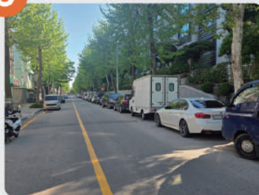
⑨ 밤가시마을 주차 문제 해결