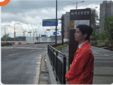
⑤ GTX, 3호선, 경의선 행 버스 노선 증진