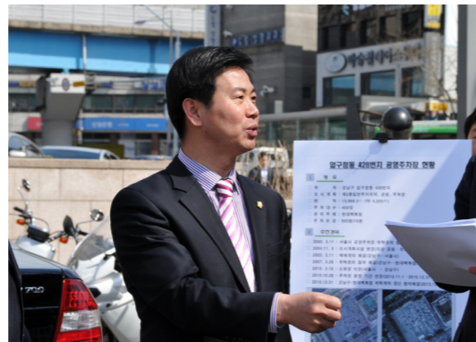
공영주차장 운영 실태 점검