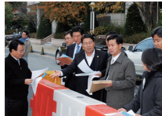
순복음교회 앞 보행자 안전 점검