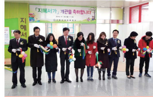
도성초 지혜서가 개관식