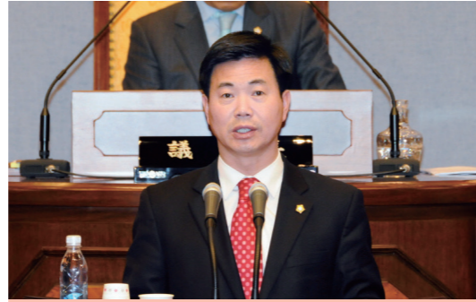
부동산 공시가격 재산정 촉구