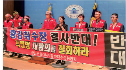
“낙동강 취수원 다변화법 철회” 합천 주민들 국회서 기자회견

주민 의견 무시 악법 규정 분류 수질개선 회피 비판 “자야수 고갈로 농업에 타격 다양한 생태 환경 피해 우려” 대책위는 특별법이 주민 의견을 무 시한 악법이라고 규정했다. 이들은 “개발 때를 한 국외의원은 그 이유로 기왕법에 따른 기금, 녹지, 오정시키고 등으로 말약은 내근으로 식 수난 우려를 운운하고있다”며 “하지만 낙동강 부류 수질개선이야말로 근본적 법안은 27일까지 입법 예고 기간을 거쳐 국회 환경노동위원회에 상정될 예정이다. 이에 대책위는 “사실의 신속 추진을 위해 예비타당성 조사 면제, 관련 16개 법규예인-해가 체계처리, 주민지원사 연대추진 등 이어 포항지역법”이라