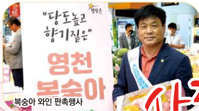
복숭아 와인 판촉행사