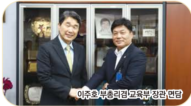
이주호 부총리 겸 교육부 장관 면담