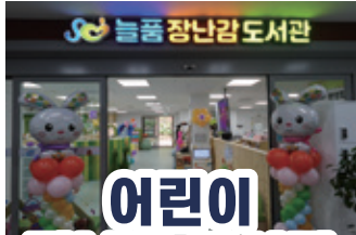
어린이 장난감 도서관