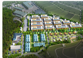
전국 최초 자원순환형 스마트 축산단지시범사업 광석 스마트 축산 단지 조성 (2027년 착공 예정)