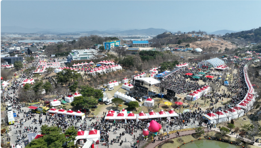
2026 논산딸기축제 방문객 약 67만 명, 딸기 판매 약 150톤, 매출액 약 15억 2천만 원