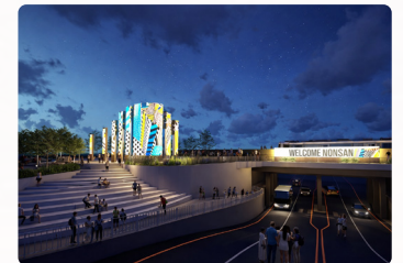
오거리 랜드마크 2026년 7월 착공, 12월 준공 예정