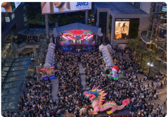
2024 농식품 해외박람회 태국 방콕

약 6,534톤 (약 14,432백만원) / CJ, 삼성웰스토리 등 납품