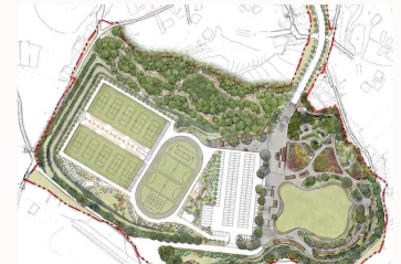
다목적 체육공원(논산시 강산동) 2027년 착공, 2029년 준공 예정