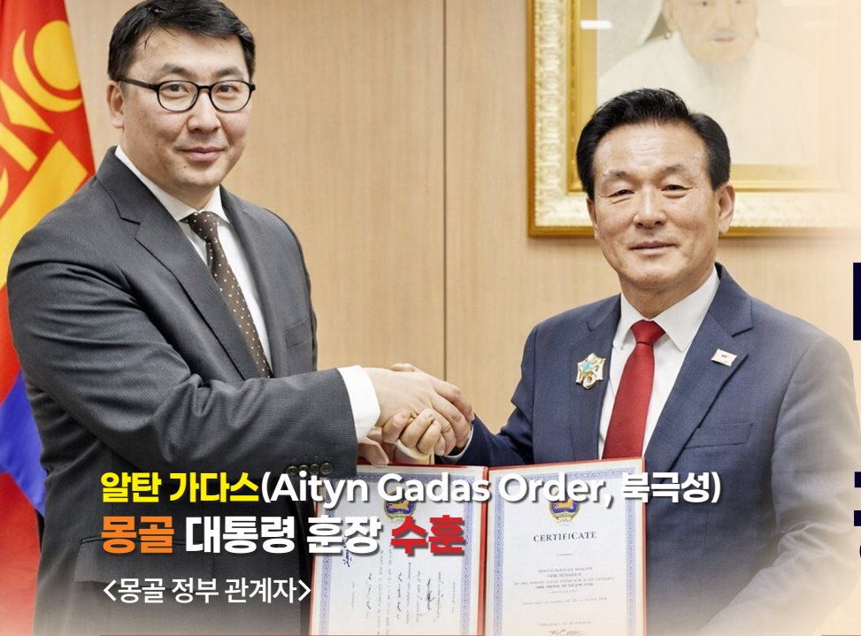
알탄 가다스(Aityn Gadas Order, 특극성) 몽골 대통령 훈장 수훈 〈몽골 정부 관계자〉