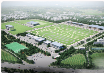
국방미래기술연구센터 2026년 착공 예정