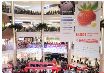
2025 농식품해외박람회 인도네시아자카르타