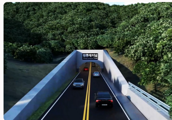
오랜 숙원 사업 향릉재 터널 건설 2026년 보상 예정