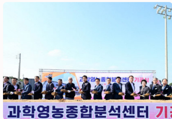
과학영농종합분석센터 기 과학영농종합분석센터 2025년 착공, 2026년 준공 예정