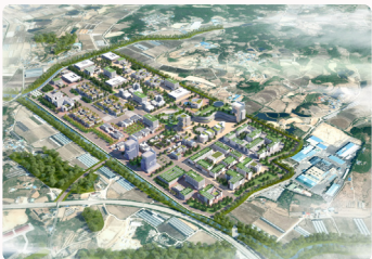
전국 최초 국방국가산업단지 조성 2026년 7월 착공 예정