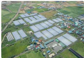
스마트팜 복합단지 2026년 2월 착공