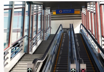
논산역 에스컬레이터 설치 2026년 4월 입찰 공고