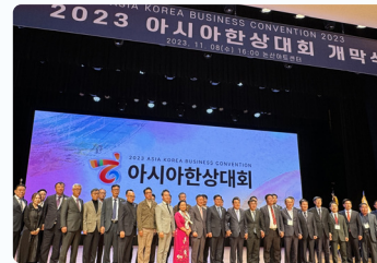
2023 국내지자체최초 아시아한상대회개최