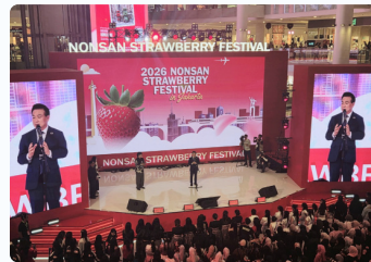
2026 농식품해외박람회 인도네시아자카르타