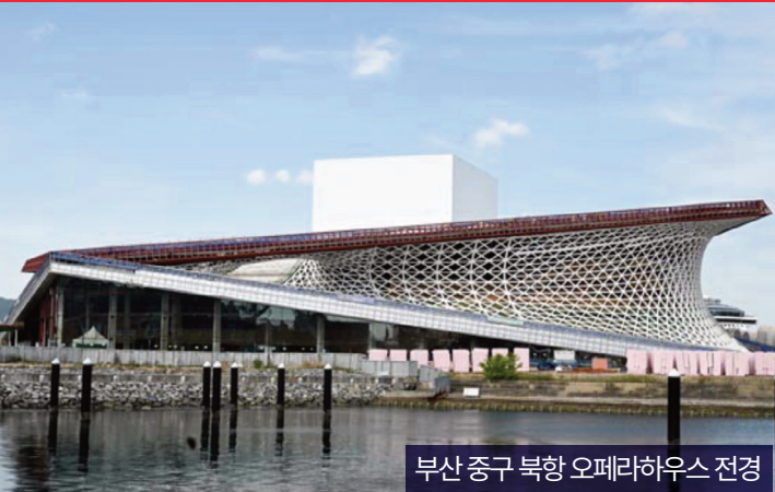
부산 중구 북항 오페라하우스 전경