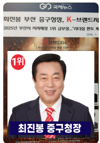
K-브랜드지수 부산시 기초자치단체장 1위 (2025년)