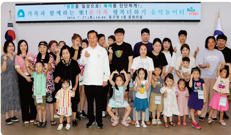
온가족 행복더하기 음악놀이터