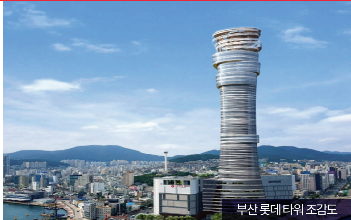
부산 롯데타워 조감도