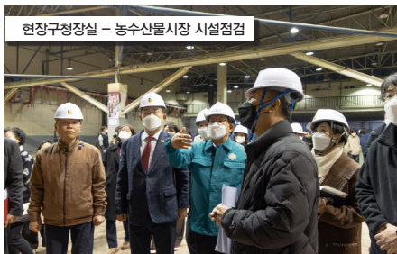
현장구청장실 - 농수산물시장 시설점검