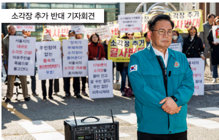
소각장 추가 반대 기자회견