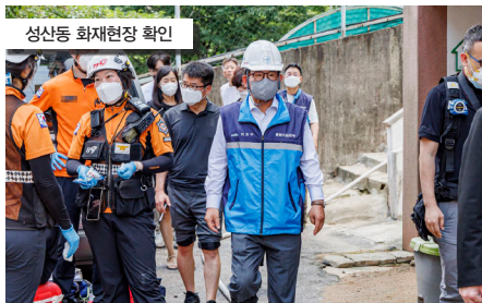
성산동 화재현장 확인