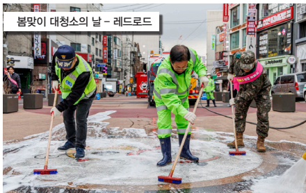
봄맞이 대청소의 날 - 레드로드