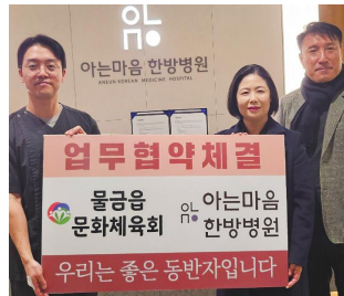
한방병원과 MOU체결 후 정기후원