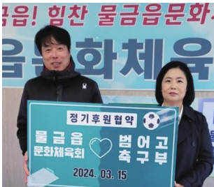
범어고 축구부 후원

혼자서 할 수 있는 봉사에는 한계가 있습니다. 사람과 사람, 단체와 사람을 연결해 더 큰 나눔을 실천했습니다.