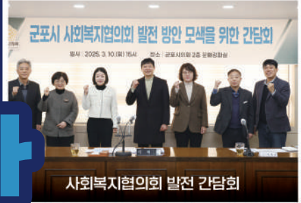
사회복지협의회 발전 방안 모색을 위한 간담회