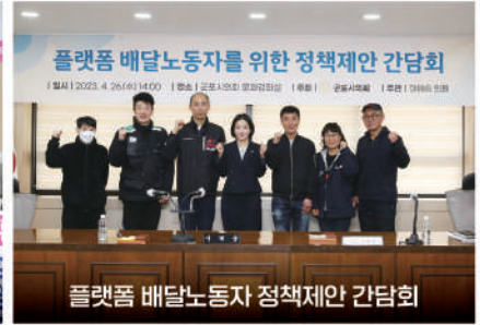
플랫폼 배달노동자 정책제안 간담회