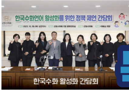
한국수화 활성화 간담회