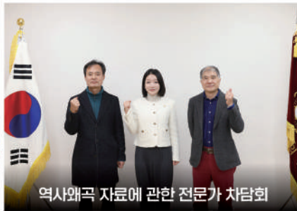
역사왜곡 자료에 관한 전문가 차담회