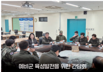
예비군 육성발전을 위한 간담회