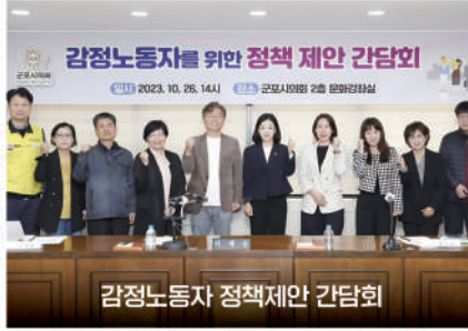
감정노동자 정책제안 간담회