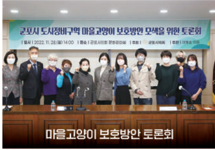
마을고양이 보호방안 토론회