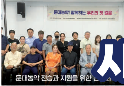
문대농약 전승과 지원을 위한 간담회