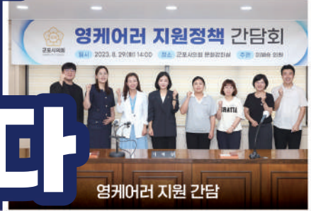
영케어러 지원 간담