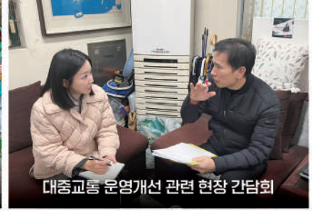
대중교통 운영개선 관련 현장 간담회