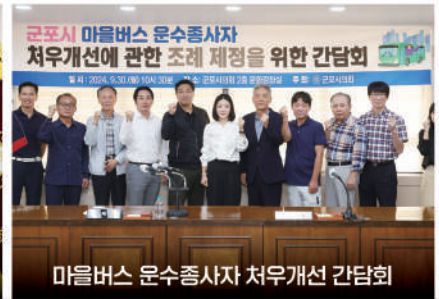
마을버스 운수종사자 처우개선에 관한 조례 제정을 위한 간담회