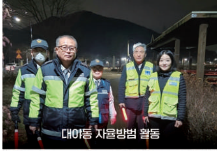
대야동 자율방범 활동