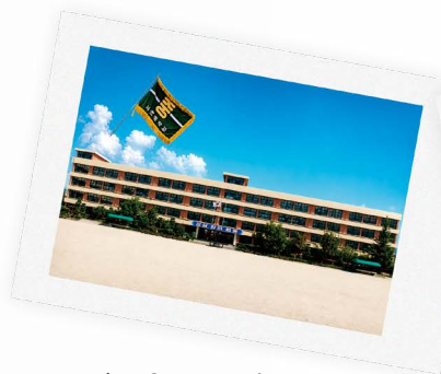
서초중 졸업당시 학교전경