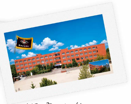
반포고 졸업당시 학교전경