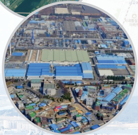
경상북도 구미시 지산동