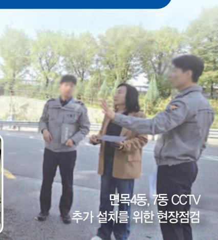
면목4동, 7동 CCTV 추가 설치를 위한 현장점검