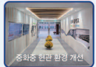
중화중 현관 환경 개선