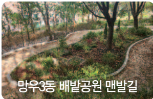
망우3동 배밭공원 맨발길