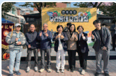
면목시장 - 우리동네 요리대회 개최