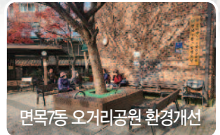
면목7동 오거리공원 환경개선