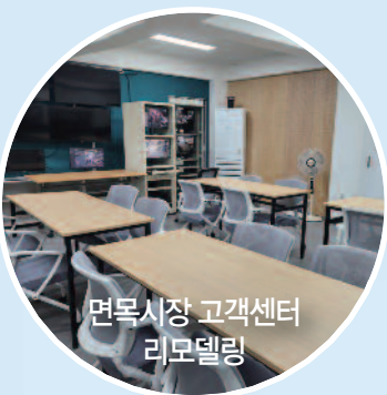
면목시장 고객센터 리모델링