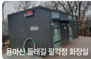
용마산 돌레길 팔각정 화장실