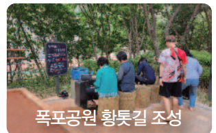
폭포공원 황톳길 조성