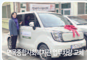
면목종합사회복지관 업무차량 교체