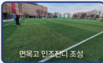
면목고 인조잔디 조성