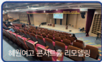
혜원여고 콘서트홀 리모델링