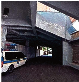
사직야구장 내 우범지역