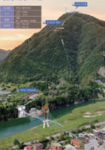
영월 봉래산 명소화사업