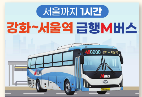
▲ 강화-서울 광역급행 M버스