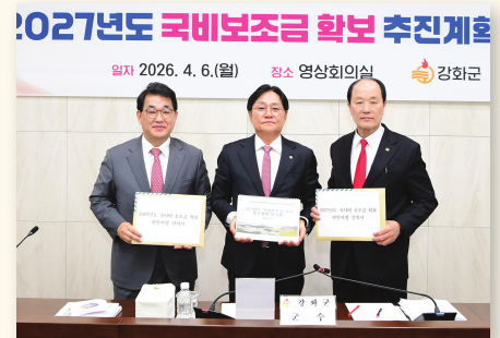
▲ 국비보조금확보 군청회의