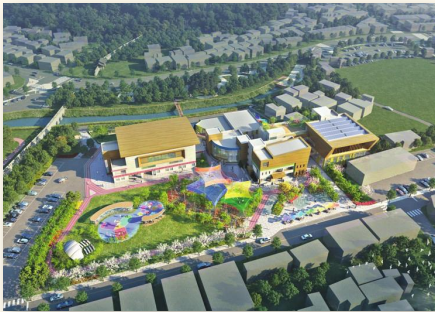
▲ 청소년 복합문화단지 조감도