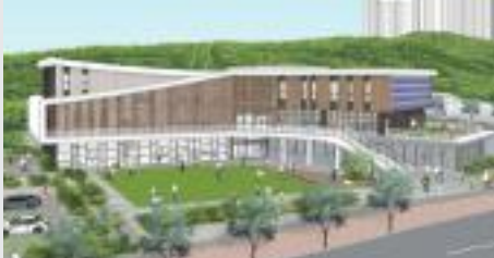
▲ 근로자종합복지관 조감도