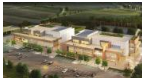
▲ 강릉농업기술센터 조감도