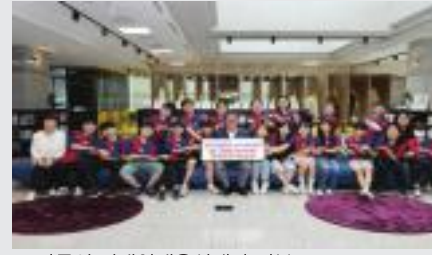
▲ 강릉시 미래인재육성재단 기부