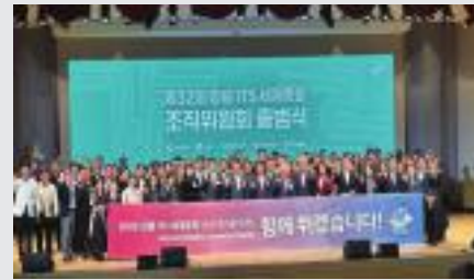
▲ 2026 ITS세계총회 출범식