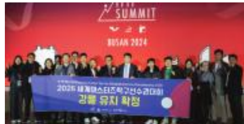
▲ 2026 세계마스터즈 탁구대회 강릉유치 확정