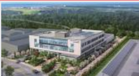
▲ 천연물전주기표준화허브센터 조감도