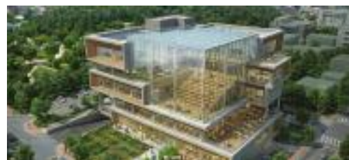
▲ 강릉시립도서관 조감도