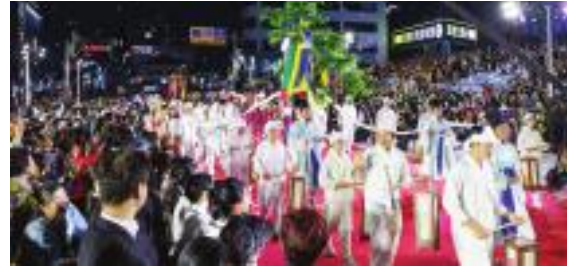
▲ 강릉단오제 길놀이