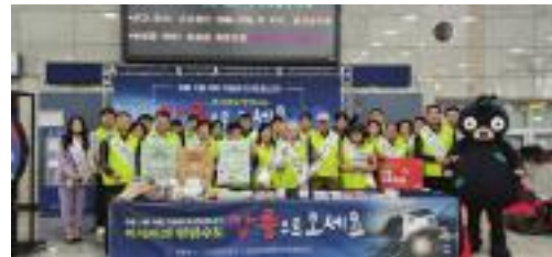
▲ 글로벌 관광 범시민 캠페인