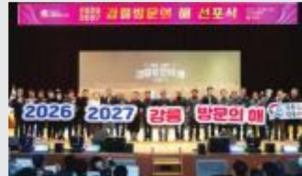
▲강릉방문의 해 선포식