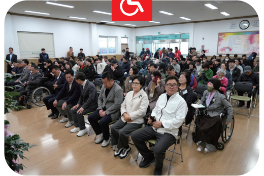
260316 영천시장애인종합복지관 22주년 개관기념