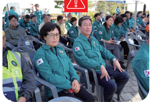
251105 재난대응 안전한국훈련 참관