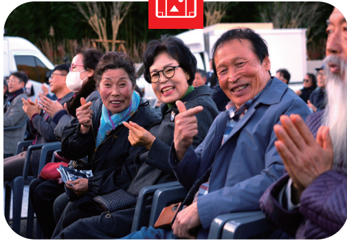
251211 신성일기념관 개관식