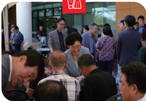
250730 영천시국민체육센터 개관식