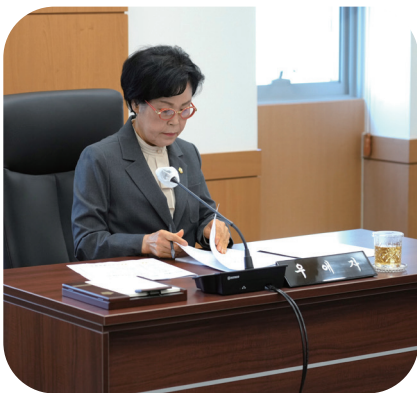
250926 영천시 빈집활용 방안 연구회 최종보고