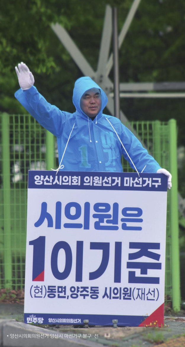
• 양산시의회의원선거 양산시 마선거구 분구 전