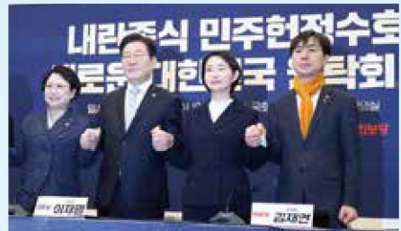
*내란종식 민주헌정수호 새로운 대한민국 원탁회의 출범식(25.2.19) 윤석열 탄핵 심판에 따른 조기 대선에서 국민의힘 재집권 저지를 위해 당시 5개 원내야당이 공동으로 출범