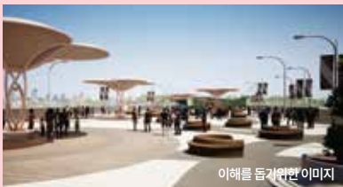
이해를 돕기위한 이미지