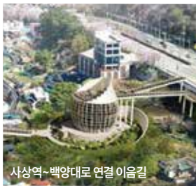
사상역~백양대로 연결 이음길