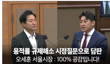
용적률 규제해소 시정질문으로 답변 오세훈 서울시장 : 100% 공감입니다!