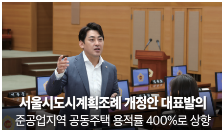
서울시도시계획조례 개정안 대표발의 준공업지역 공동주택 용적률 400%로 상향