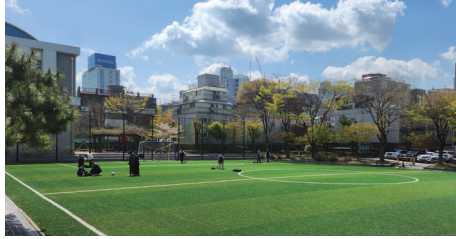
* 상기 이미지들은 이해를 돕기위한 이미지입니다