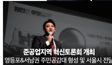
준공업지역 혁신토론회 개최 영등포&서남권 주민공감대 형성 및 서울시 전달