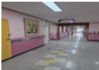
팔달초 방화구획 개선공사