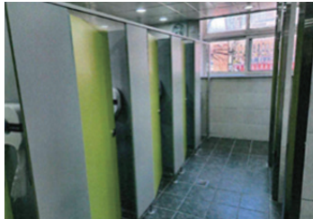
우만초 화장실 개선공사