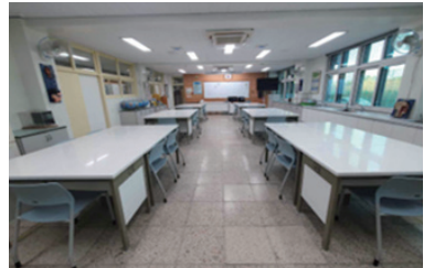
효성초 과학실 환경개선