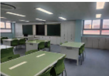
유신고 고교학점제 공간조성