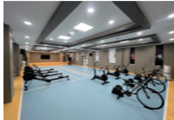
매향여자정보고 IT 체육교실 설치 지원