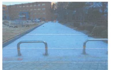
지동초 교사측면 어린이 놀이터 앞 포장