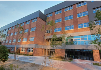
인계초 그린스마트 미래학교사업 완료