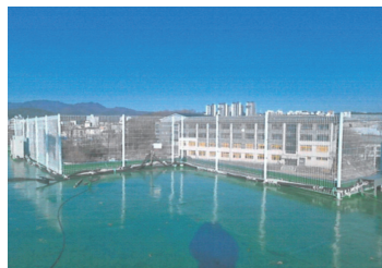
삼일공고 옥상 및 외벽방수공사