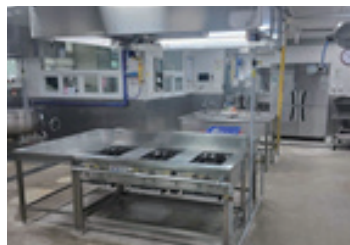
삼일중 급식실 바닥교체 추진중