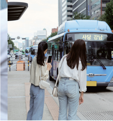
사당·강남 광역버스노선 신설추진