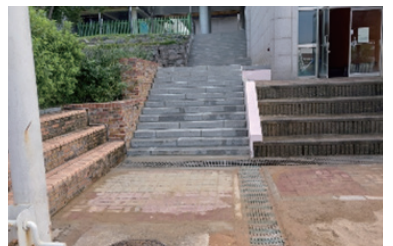
연무초 오페수관로 보수공사