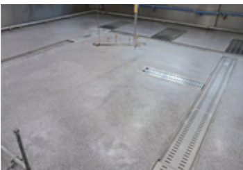
매향중 급식실 바닥교체