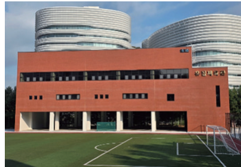
창현고 체육관 증축