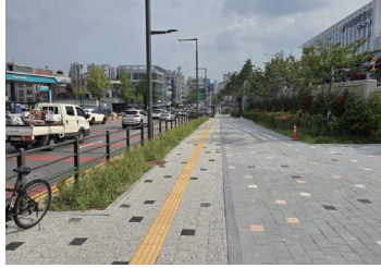
팔달경찰서 공공공지 및 진입로 도로개설공사