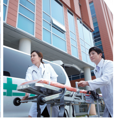
24시간 응급·소아진료 추진