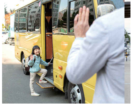
학생통학차량 지원사업 확대