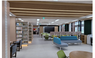
삼일고 학교도서관 공간재구조화 사업