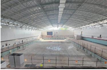
새천년 수영장 대규모 리모델링