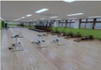
동성중 IT 체육교실 설치 지원