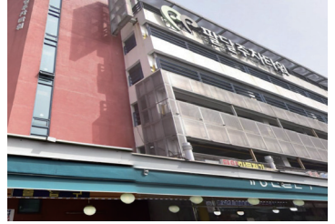
팔달 주차타워 관리시스템 설치