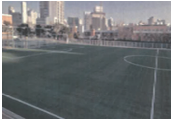
수원공업고 인조잔디 재조성