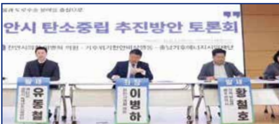
탄소중립 추진방안 토론회 주관