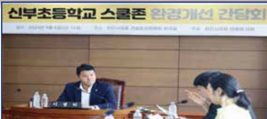
신부초등학교 스쿨존 간담회