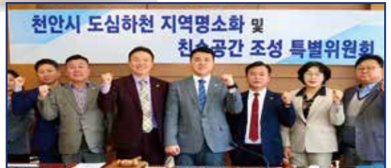
천안시 도심하천 지역명소화 및 친수공간 조성 특별위원회