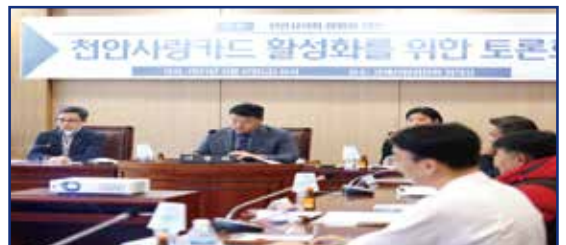
천안사랑카드 활성화를 위한 토론회