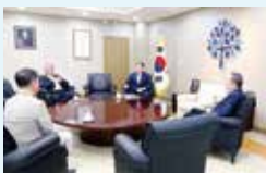
명지대 총장님과 차담회