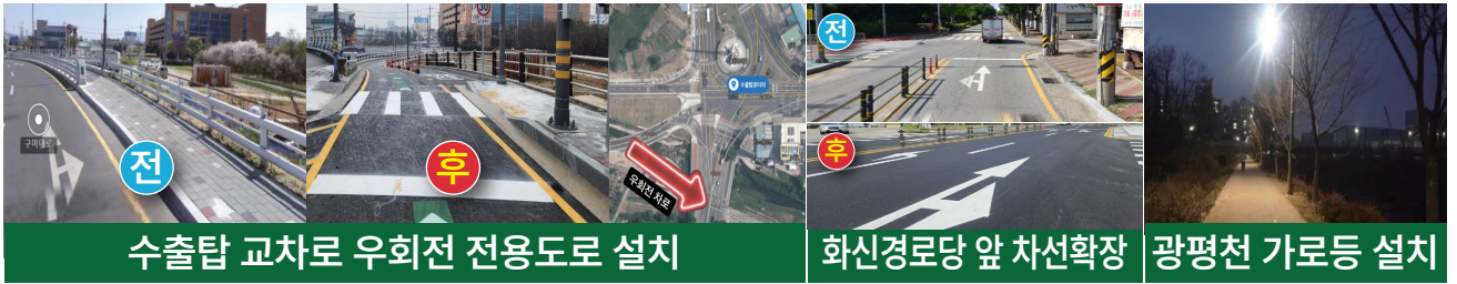
수출탑 교차로 우회전 전용도로 설치