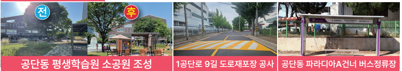
공단동 평생학습원 소공원 조성