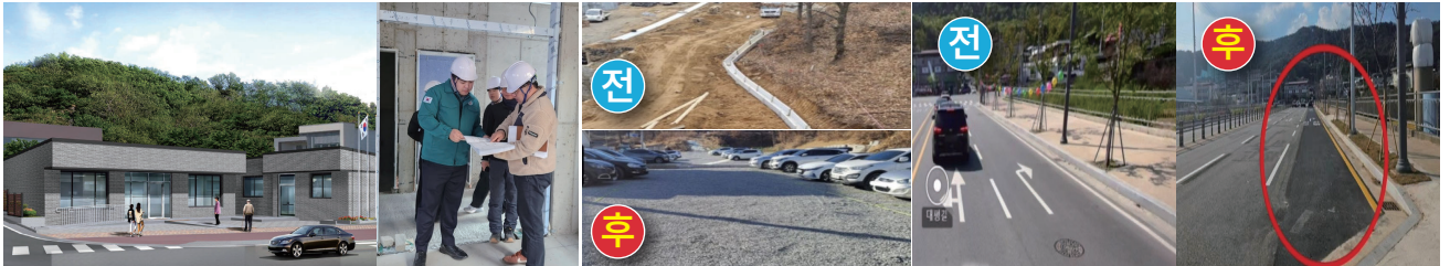
지산2동 경로당 및 마을회관 신축