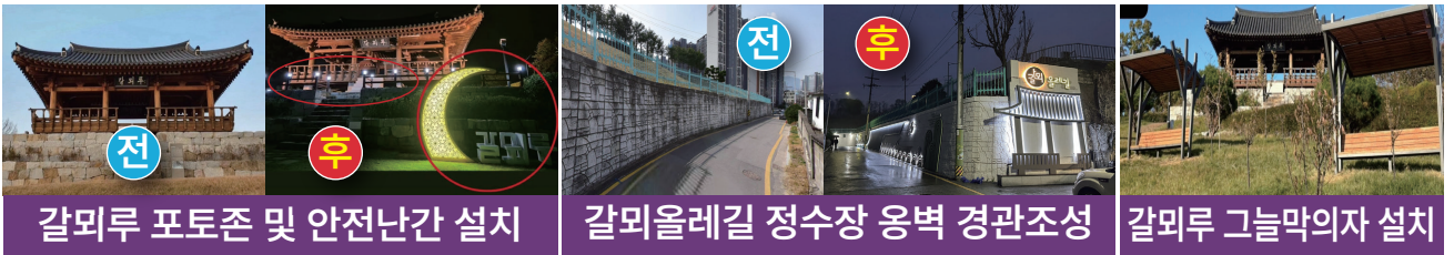
갈미루 포토존 및 안전난간 설치