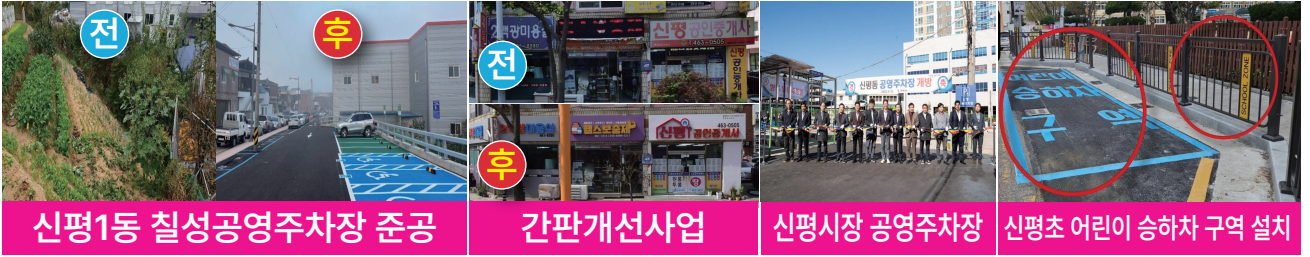
신평1동 칠성공영주차장 준공