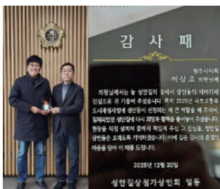
▶'성안길 상점가상인회' 일동 감사패