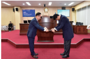
▶청주시의회 의정봉사상 수상