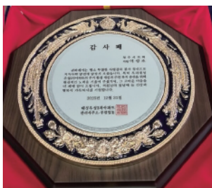
▶'대성동우성3차 아파트' 주민일동 감사패