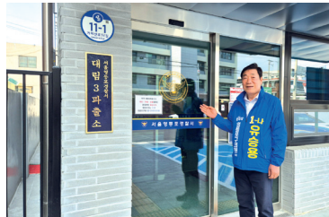
대림3동파출소 신축 현장 방문