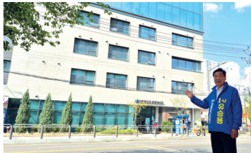
신길6동 공공복합청사 신축 현장 방문

신길6동, 대림1,2,3동 현안사업을 챙기며, 참 많은 일을 추진했습니다. 신길6동, 대림3동 공공복합청사 건립, 영등포제3스포츠센터 신축 등 주민숙원사업 추진에 앞장 섰습니다. 앞으로도 현장에서 답을 찾고, 생활 속 불편을 해결하는 의정 활동을 이어가겠습니다.