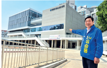
영등포 제3스포츠센터 신축 현장 방문