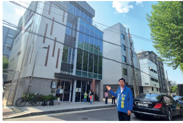
원지공원도서관 신축 현장 방문