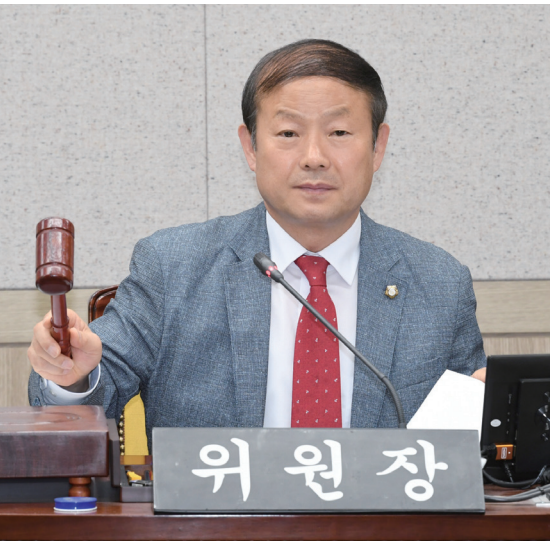
영등포구의회 제9대 사회건설위원장(전반기)