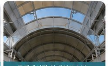
모래내시장 아케이드 보수