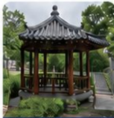
인후공원 팔각정 지붕보수