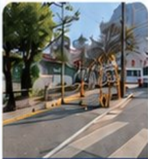
복일초 경사로 자동제설장비