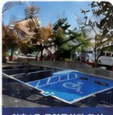
인후1동 공영주차장 조성