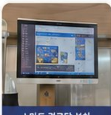
스마트 경로당 설치