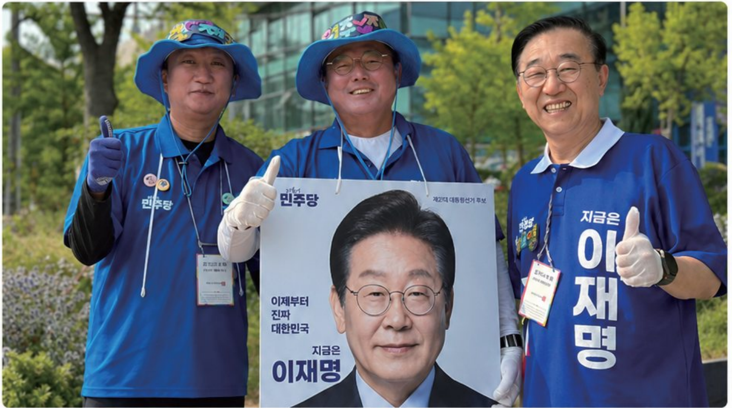
김윤덕 장관과 함께

이재명 승리를 위해 발로 뛰고, 김윤덕 의원과 함께 지역과 정치를 잇는 힘을 만들었습니다