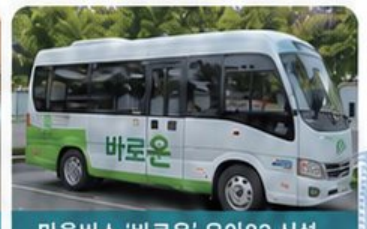
마을버스 '바로온' 우아82 신설

- 시의원선거 지역구가 변경되어 인후1동과 인후2동 사업은 전주시의회 의원 모두가 함께 노력한 사업임을 밝힙니다 -