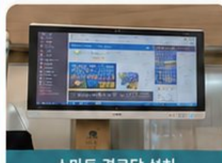
스마트 경로당 설치