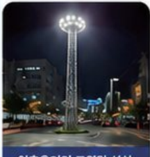
인후육거리 조명탑 설치