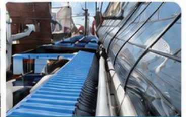
모래내시장 노후전선 정비