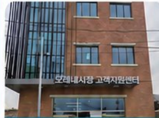
모래내시장 고객센터 신축