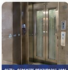
안골노인복지관 엘리베이터 설치