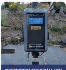
도로결빙방지 안티아이싱 설치