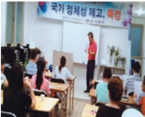
다문화가정 대상 특강