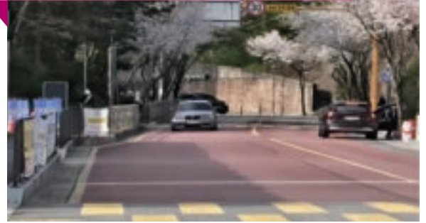
대동아파트 주민을 위한 도로 확장