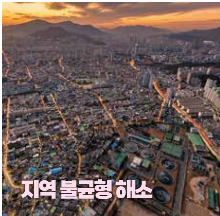
지역 불균형 해소