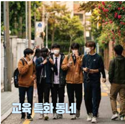
교육 특화 동네