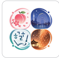
세종 4대 축제 완성