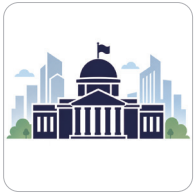
행정수도 기반 완성