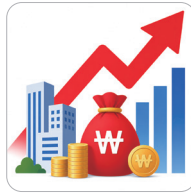
역대 최대 국비·투자 유치