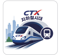
CTX 지하철 시대