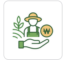
농어민 수당 최초 지급