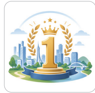
전국 최고 살기좋은 도시 1위