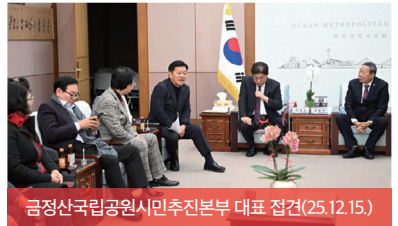
금정산국립공원시민추진본부 대표 접견(25.12.15.)