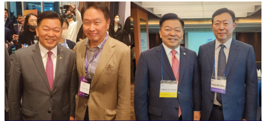
전국 기업인들과의 네트워크 교류