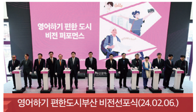
영어하기 편한 도시 비전 퍼포먼스(24.02.06.)