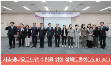
저층생태응로드맵 수립을 위한 정책토론회(25.10.30.)