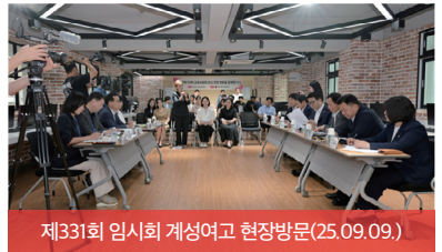
제33회 임시회 계성여고 현장방문(25.09.09.)