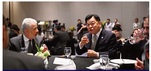
해외 바이어 및 글로벌 기업과의 비즈니스 미팅

북항재개발 완공이 다가오는 지금, 동구에는 기업을 알고, 세계와 소통하며, 투자를 이끌 수 있는 행정가가 필요합니다. 경험이 있는 사람과 없는 사람의 차이는 분명합니다