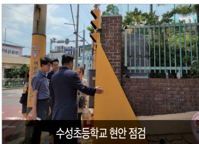
수성초등학교 현안 점검