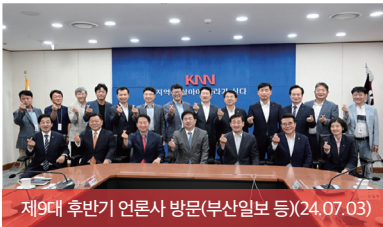
제9대 후반기 언론사 방문(부산일보 등)(24.07.03)