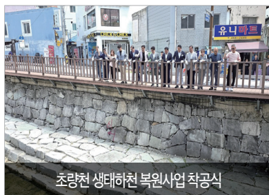
초량천 생태하천 복원사업 착공식