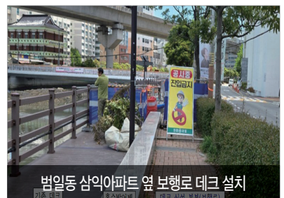
범일동 삼익아파트 옆 보행로 데크 설치