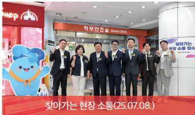
찾아가는 현장 소통(25.07.08.)