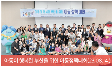
아동이 행복한 부산을 위한 아동정책대회(23.08.14.)