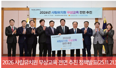
2026년 사립유치원 무상교육 전면 추진 정책발표(25.11.21.)