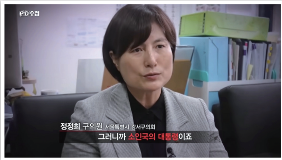
※ 2023. 08. 08 MBC PD수첩 '위원장님의 공천장사' 편 인터뷰