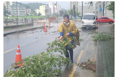
태풍 힌남노 당시 도로 안전 정비