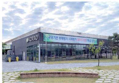
KORAD, 경주시시설관리공단 충효동 유치