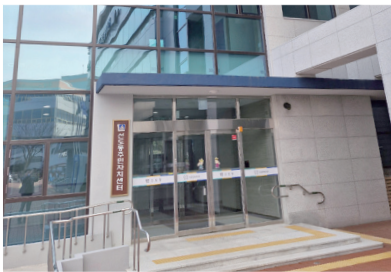
선도동 주민자치센터 증축

열심히 음지에서 묵묵히 일하시는 분들이 많기에 세상은 돌아갑니다. 그러한 분들이 이 세상의 주인이 되어 이 민주주의 사회를 당당히 이끌어 가야합니다. 정말 열심히 일하며 지역발전을 위해 헌신하는 시의원을 뽑아야 세금이 아깝지 않습니다. 보다 진취적이고 공부하며 초심을 잃지 않는 자세로.. 항상 경륜을 갖춘 어르신들의 조언과 시대적 흐름에 맞는 사고로 항상 지역주민과 함께 하였습니다.