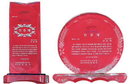
경주시청공무원이 받은 멋진 시의원 인증패 <2회 수상>